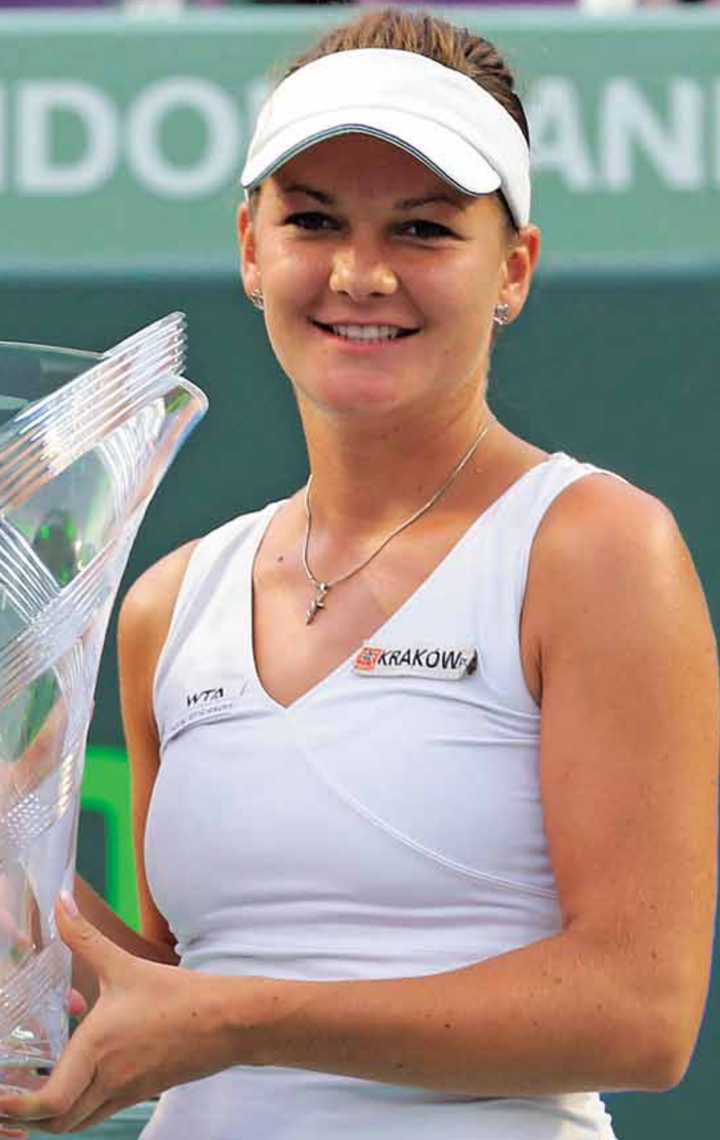
Agnieszka RADWANSKÁ (SR/Pol.), vítězka Miami 2011