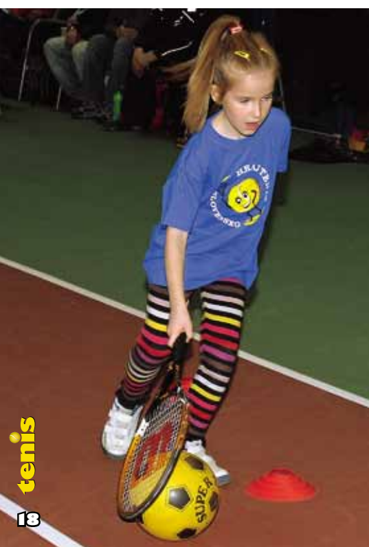
Ukážka cvičenia pre deti v podaní malej tenistky